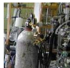
可燃性ガスの 使用場所監視