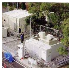
水素供給 ステーション