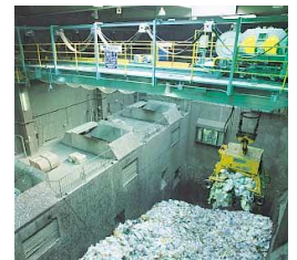
ゴミ焼却場などの 発火監視