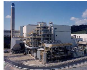
プラント、工場内の 火気厳禁場所監視